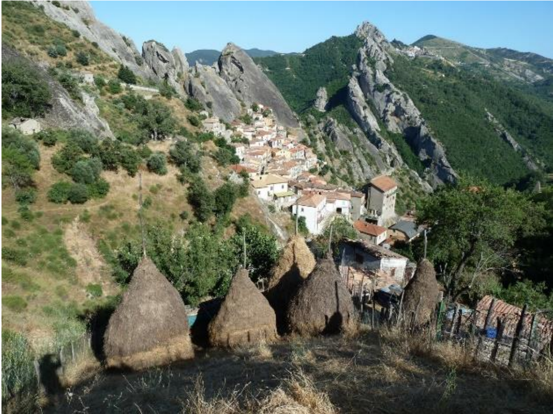
Fig. 1 - La dorsale arenacea della Zona Speciale di Conservazione “Dolomiti di Pietrapertosa” ripresa da Nord-Ovest con l’abitato di Castelmezzano in primo piano e Pietrapertosa sullo sfondo.

di Consiglio Direttivo n. 63 dell’11 settembre 2019.